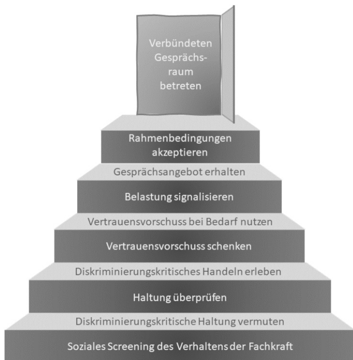
Abb. 1: Stufen, um einen verbündeten Gesprächsraum zu betreten (eigene Darstellung)