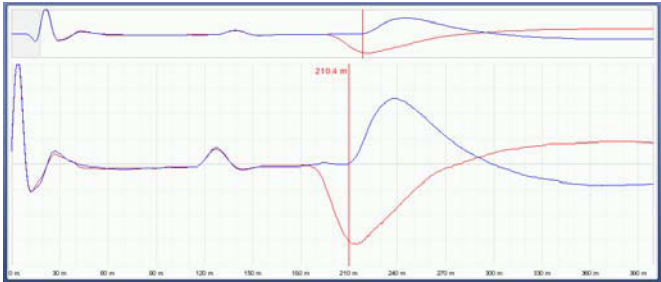
Bild 6.1 Reflexion am Fehler (negativ), Reflexion am Kabelende (positiv)